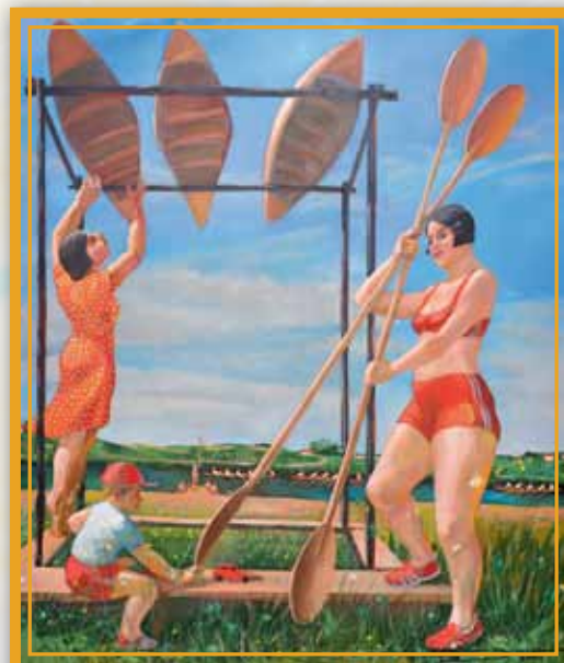
«Байдарки сохнут» (ХМР, 170x140), 2018