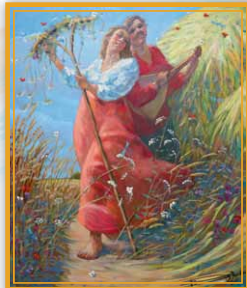
«Василек и Василиса» (XMP, 170x140), 2005