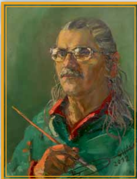
«Автопортрет» (XMP, 45x30), 2012