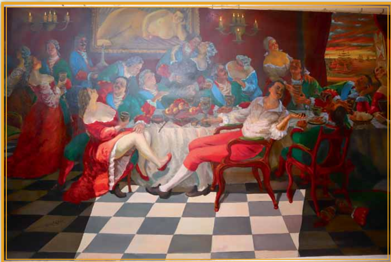
«Ассамблея Петра I» (XMP, 260x500), 2014