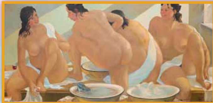
«В бане» (XMP, 95x230), 2016