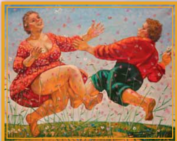
«Кадриль» (ХМР, 120х140), 2018