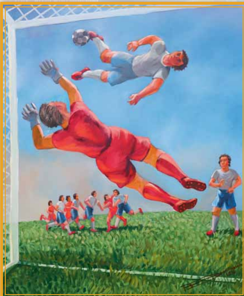
«Штрафной угловой "в девятку"», домашняя заготовка (ХМР, 170x140), 2018