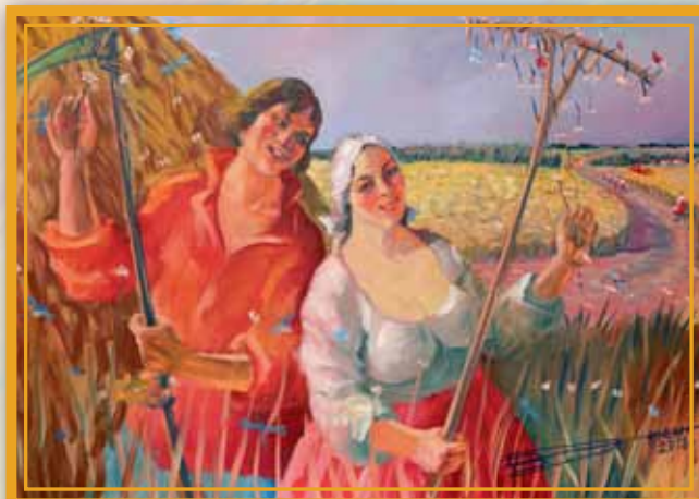
«Вечером в деревне» (ХМР, 120х140), 2018