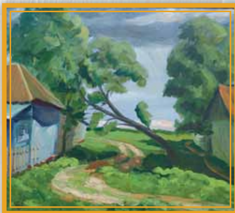
«Двор в Маланино» (ХМР, 75x80), 2010

Виктор Андреевич имеет самый высокий рейтинг среди воронежских художников. Его имя широко известно не только в нашей стране, но и за рубежом, особенно в Европе и Америке.