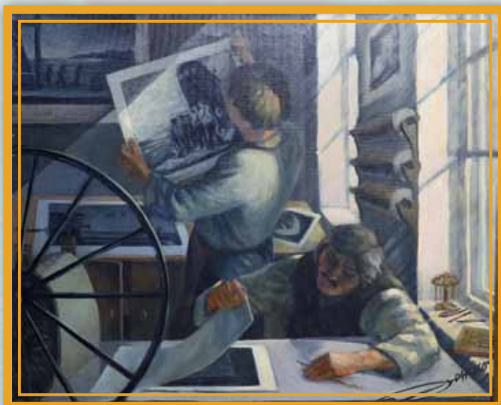
«Двойной автопортрет офорт» (ХМР, 130x140), 2005