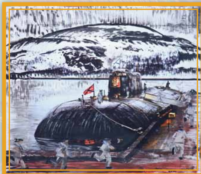
«Подводная атомная лодка в бухте Западная Лица» (ХМР, 130x135), 2015