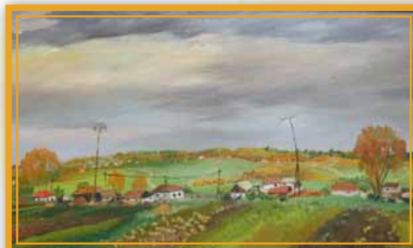
«Маланинские поля» (ХМР, 75х125), 2005